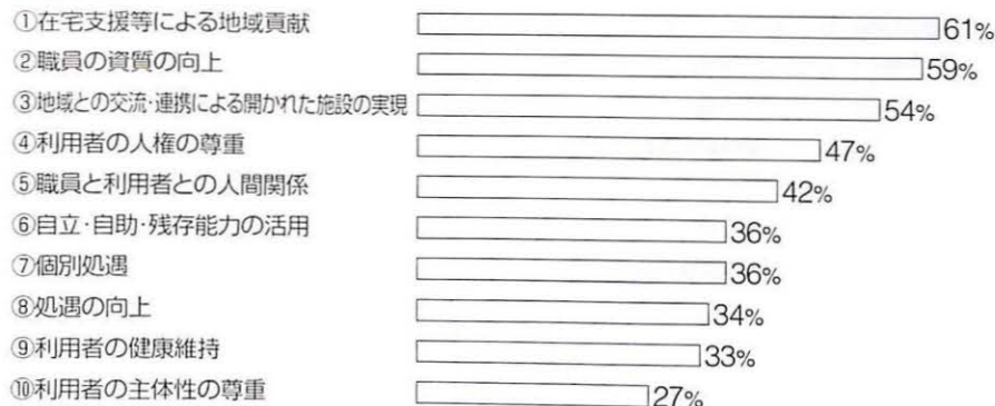
図2 理念・方針のキーワード【重複回答】

〒980-8511 東北学院大学 経済学部 商学科 岡田研究室 電子メール: okada@tsc.tohoku-gakuin.ac.jp