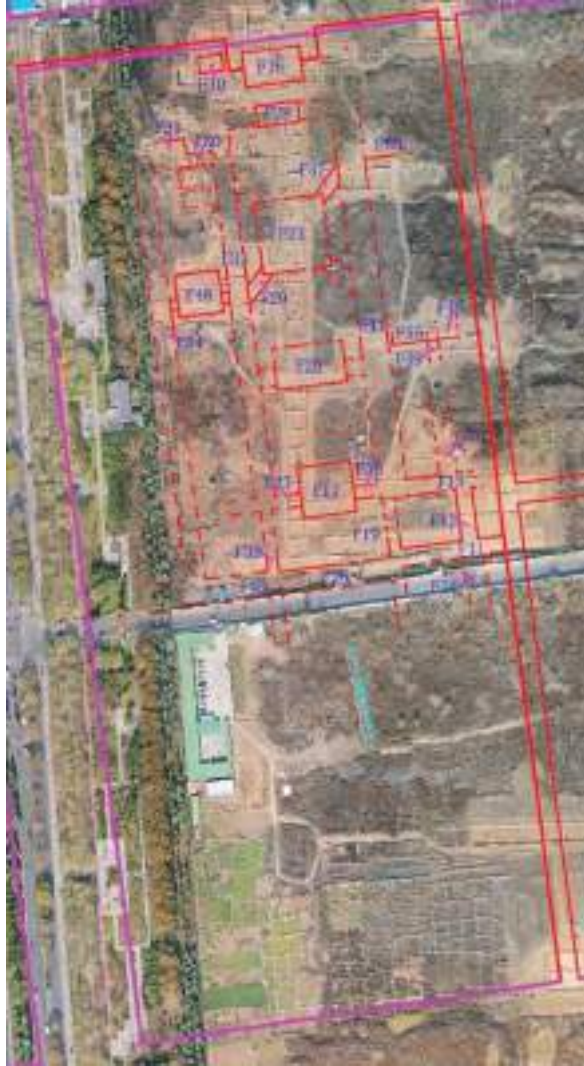
图六 I 号院落建筑平面布局

排列有序。从北向南第一处建筑 F16，台基东西面阔 33 米，南北进深 18 米，台基南侧居中有踏步，宽约 16 米，推测为宅院北门址。第二处建筑 F21 平面形状呈近方形，台基边长约 40 米，规模较大，为宅院主殿。第三处建筑 F20 平面形状呈长方形，东西面阔 37 米，南北进深 22.5 米，为宅院殿址。第四处建筑 F17 平面形状呈近方形，台基边长约 30 米，为宅院另一处方形殿址。另外，在轴线建筑两侧发现了南北向廊房。