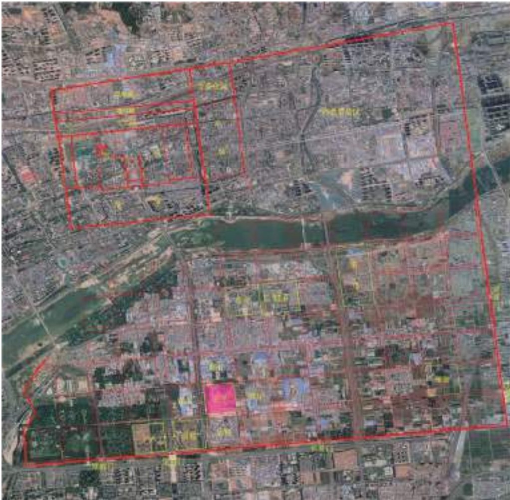
图一 隋唐洛阳城正平坊位置示意图

文献记载，坊内有孔子庙、国子监、安国女道士观(本太平公主宅、安国相王宅)，安史之乱时，安庆绪囚甄济于安国观；兵部尚书李迥秀宅、左散骑常侍、襄阳郡王路应宅、右领军卫将军上柱国新城县开国伯薛璇宅、中大夫使持节原州诸军事检校原州都督群牧都副使赐紫金鱼袋赠太仆卿上柱国修武县开国男韦衡宅、河