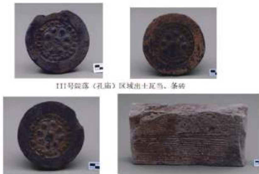
III号院落（孔庙）区域出土瓦当、条砖