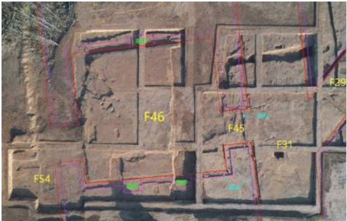
图八 F21 西南侧建筑分布图

第三，II 号、III 号院规模相近，面阔约 71 米，东西并列，同处于里坊东南隅，目前发掘出土者均是院落的南侧建筑。其中 II 号院处于东南隅中部，III 号院处于东部。结合文献资料，我们推测 II 号院为国子监，