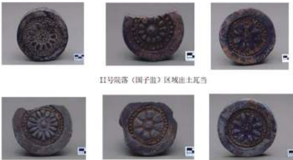
II号院落（国子监）区域出土瓦当