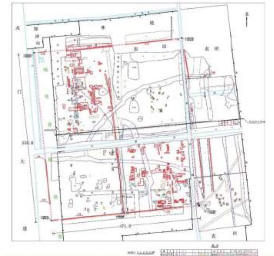
图三 正平坊遗址考古调查勘探平面图

2020 年 5 月 22 日至 9 月 8 日，洛阳市文物勘探中心对之前未勘探区域进行补充探勘，至此将整个正平坊区域全覆盖勘探。此次南区勘探发现近代墓葬 59 座、夯土 76 处、道路 15 条、踩踏面 7 个、礅墩 26 个、灰坑 23 个、烧窑 5 座、井 3 眼、砖瓦堆积区 29 个、沟 11 条、活土坑 283 个。北区勘探共发现近代墓葬 67 座、道路 13 条、井 18 眼、沟 7 条、烧窑 5 座、灶 6 个、踩踏面 5 处、夯土 70 处、砖基、砖瓦堆积区 16 处、坑 256 个。