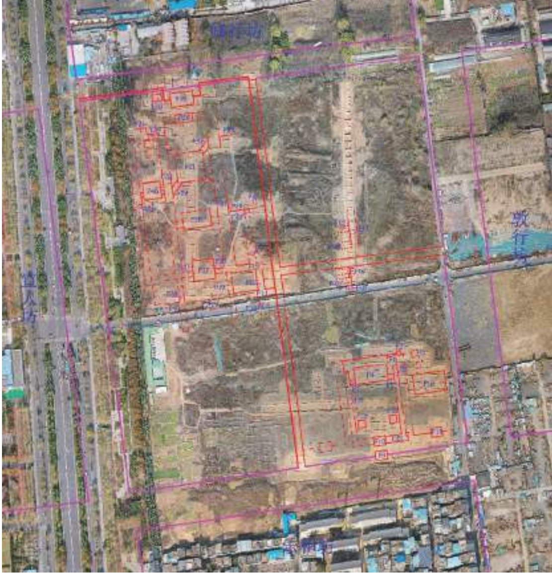
图四 正平坊遗址建筑遗迹分布情况

2020-2023 年，中国社会科学院考古研究所和洛阳市考古研究院组成联合考古队对正平坊遗址进行了持续的考古发掘工作。考古发掘与收获如下：