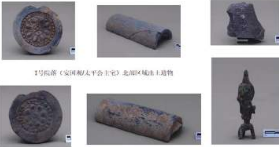
I号院落（安国刹太平公主宅）北部区域出土遗物