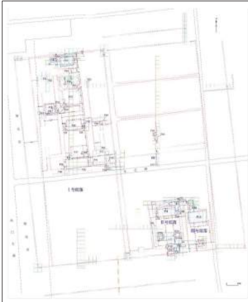
图五 正平坊遗址遗迹总平面图（截至2023年12月）

2023年，考古工作主要集中在里坊西半坊I号院落和东北隅两个片区，了解坊内院落布局和内部建筑的相互关系。重点发掘西半坊，该片区属于I号院落（太平公主宅）北半部住宅区，建筑密集，分布有序，前期已发现轴线上排布的几处大型夯土建筑。经过这次发掘，I号院落的平面布局及内部建筑结构状况更为清晰，在轴线东西两侧别院发现多处建筑遗迹。