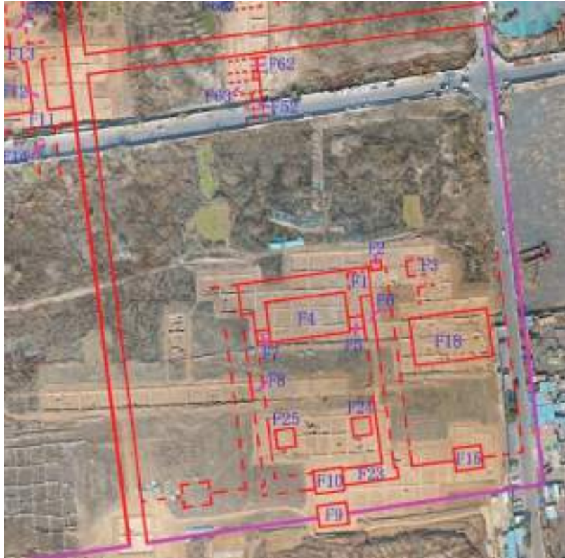
图九 II号、III号院建筑平面布局

III号院为孔庙。两处院落的平面布局较为清晰。II号院宅院南门与坊墙上所开之门南北正对，两处门址规模相近，东西面阔15米，南北进深10米；大殿东西面阔45米，南北进深23米，南侧双踏步，北侧居中单踏步，左右连接轩廊，为重要的殿堂式建筑；而且在殿前广场左右对称分布两处方形建筑，推测为碑亭或钟鼓楼。III号院四周由夯土墙围合，中心大殿东西面阔45米，南北进深28米，南侧双踏步，体量较大。两个院落均以中心大殿为核心，殿南设院门，采用中轴对称布局，布局严谨，设计美观。两院落之间为南北向过道，过道北端发现一方形建筑，推测为过街亭或望楼。