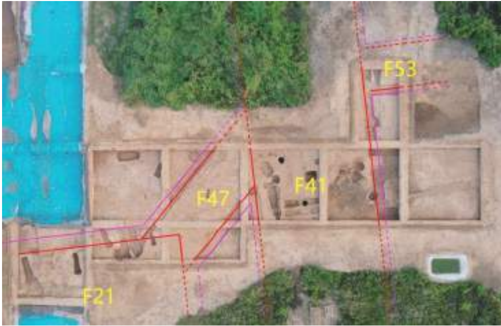
图七 F21 东北建筑分布图

在 F21 西南侧发现近方形殿址 F46，属于西部院落的建筑，台基边长约 24 米，南北两侧台基包砖及散水保存较好，南侧为左右双踏，北侧为居中设一处踏步。