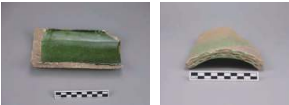
图一〇 I号院东部出土的绿釉板瓦