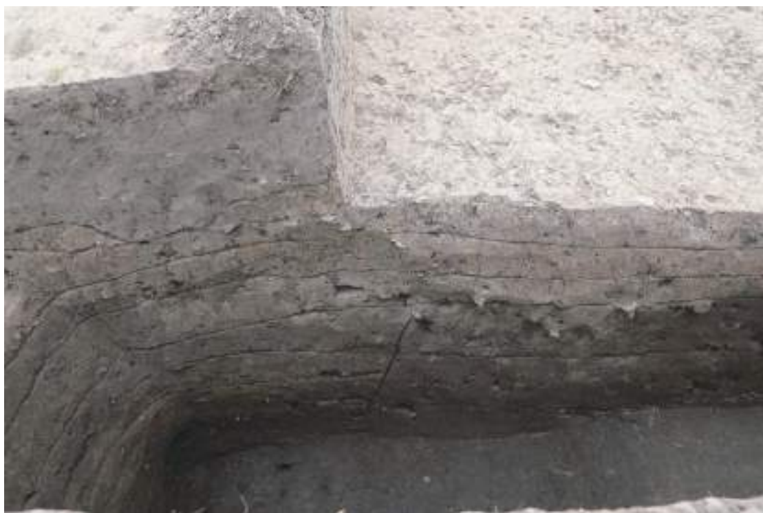
图七 Q1 东西向段基槽北口（东-西）