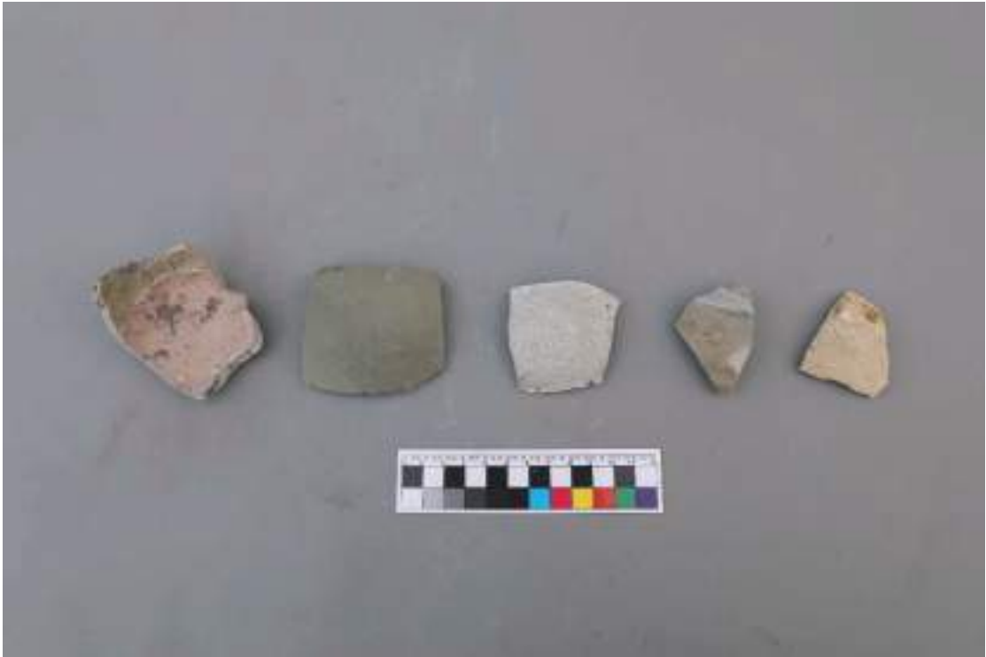
图八 Q1 城墙夯土出土瓷片