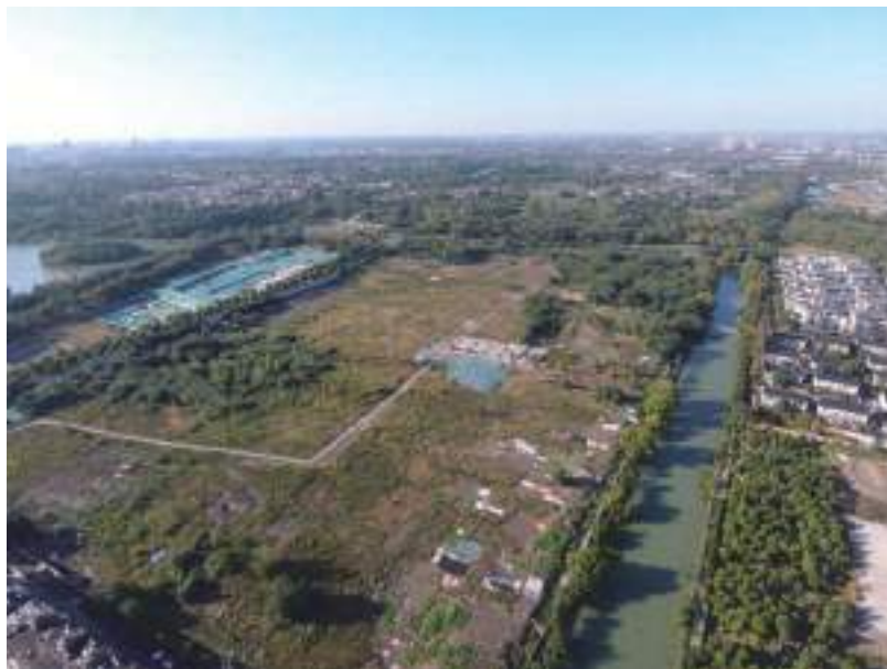
图五 桑树脚大型建筑基址群周边环境和地貌（东南-西北）