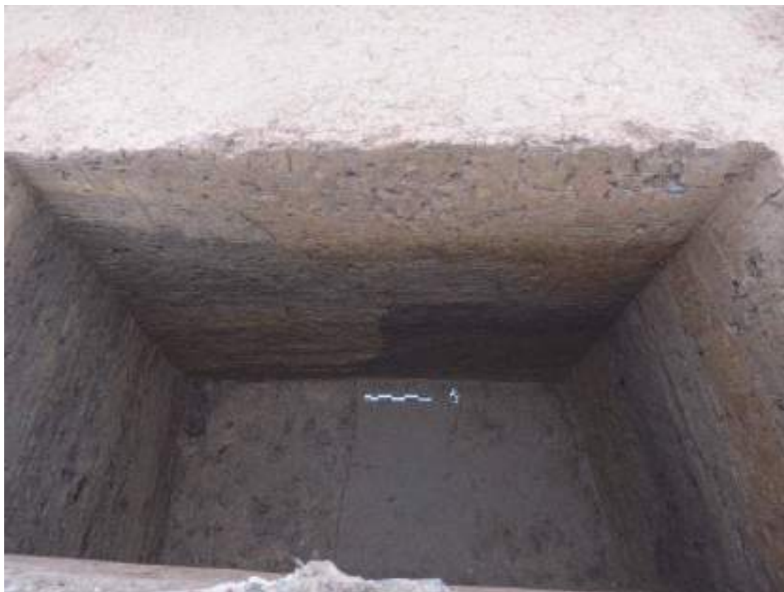
图六 Q1 南北向段基槽东口（南-北）