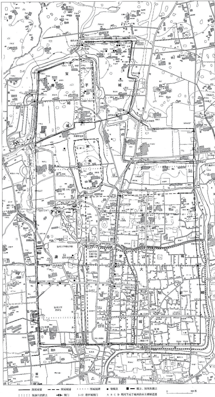
图三 扬州城遗址及考古发掘位置图（1975~2013年）