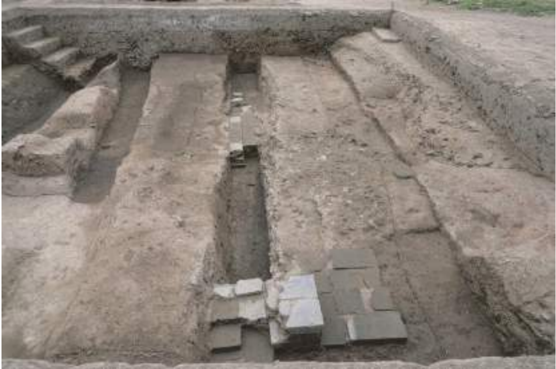
图九 Q1 东西向段北侧城墙相关遗迹（东-西）