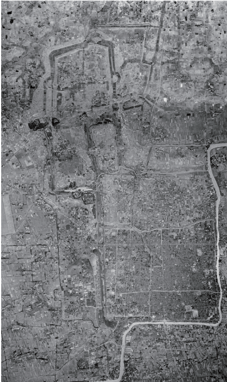
图一 扬州城遗址保存现状（航拍照片）