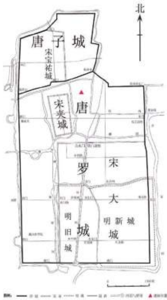
图四 唐宋明扬州城平面示意和桑树脚大型建筑基址群遗址位置图