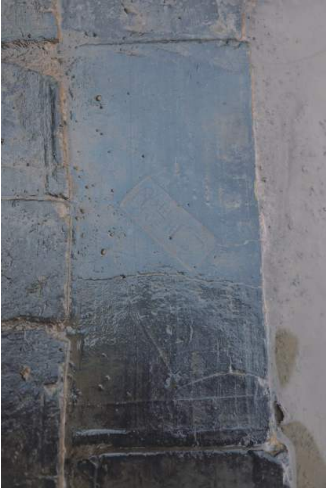
图一〇 JC2 内砌砖局部（上西）