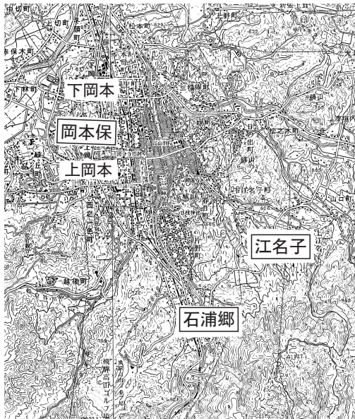
【図一】飛騨国岡本保・周辺地形図

さて、まず「注進 仁安元年（一一六六。筆者註）色々雑物進未事」とされた注進状 ⑤ の中には「岡本郷」が登場する。ここは現在の