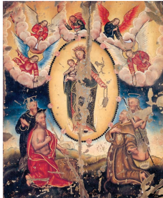
b. ロザリオの聖母像