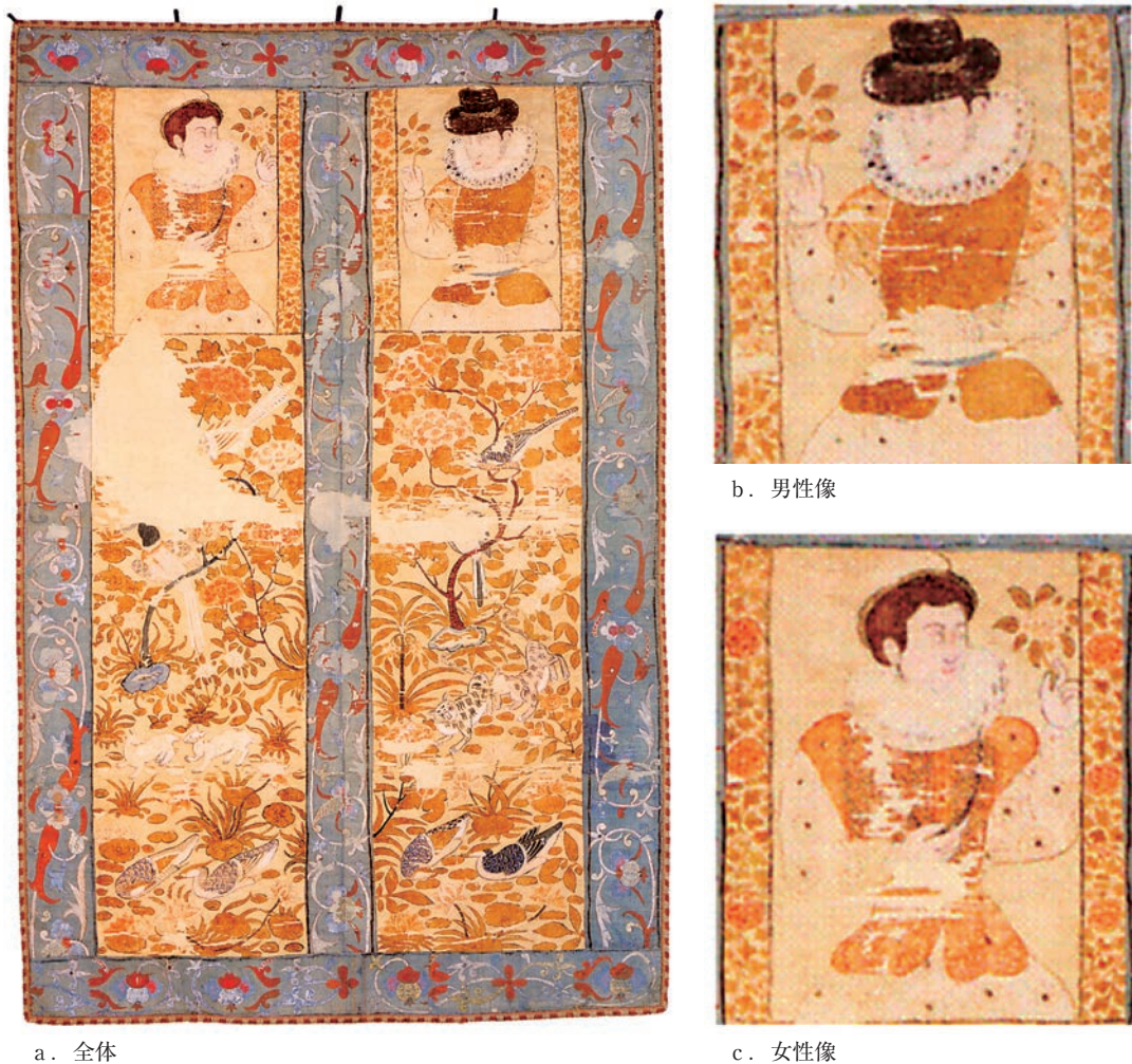
第1図 壁掛 (全体および部分)

そこで、筆者はこの壁掛の制作年代を把握するために、そこに描かれている男女の襷襟に注目した。襷襟は16世紀後半～17世紀前半に西欧を中心に見られる襟型式で、年代が降るに従って徐々にその直径を増すという形式的な変化が認められる。これに基づき検討した結果、壁掛に描かれた襷襟は1580年代後半～1610年代前半の特徴を示すことが明らかになり、制作年代もこの頃であるとの結論に至った(佐々木2019)。その結果、この壁掛は慶長使節の将来品と理解しても年代的な矛盾はないことが確認された。