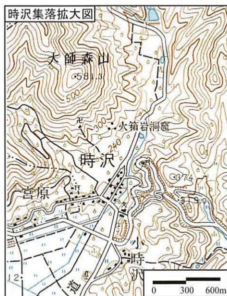
果樹の記号はほとんどがブドウ園である。 地形図は国土地理院発行の5万分の1「赤湯」 (平成12年要部修正) の一部を140%に拡大して使用。